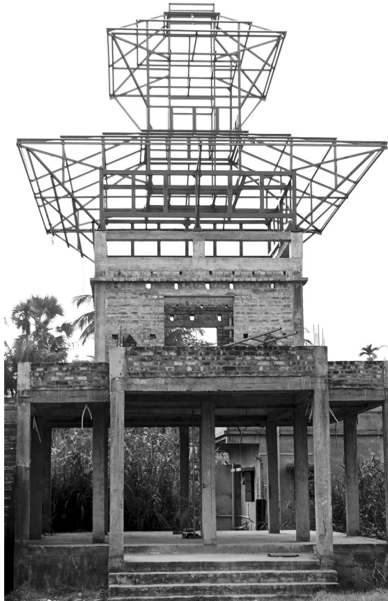
संयुक्त नेपाली वेलफेयर ट्रस्टद्वारा निमाणाधिन श्री पशुपतिनाथ मन्दिर