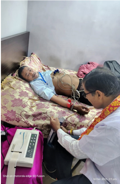
Shot on motorola edge 50 fusion